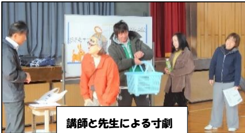
講師と先生による寸劇